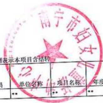
对下转移支付项目绩效目标公开表